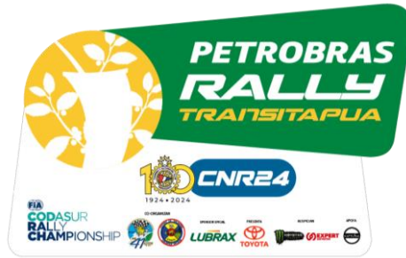
TABLA DE HORARIOS DE ACTIVIDADES Y CIERRE DE RUTAS XXXVI PETROBRAS RALLY TRANSITAPUA